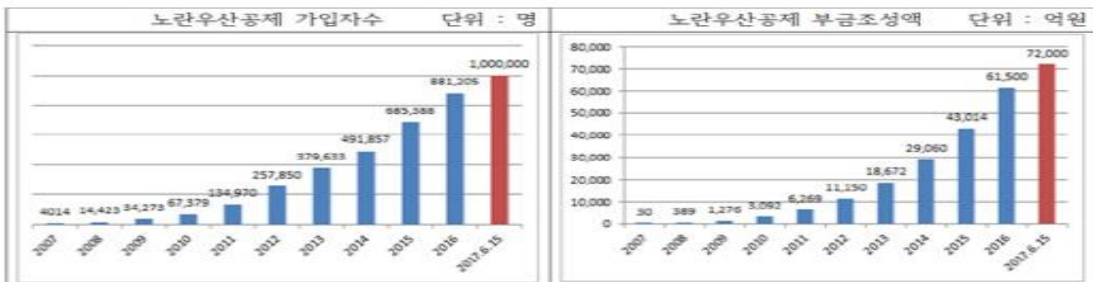
<노란우산공제 가입자수 및 부금조성액 추이(누적)>